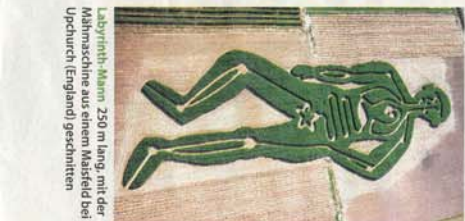
Labyrinth-Mann 250 m lang, mit der Nähmaschine aus einem Maisfeld bei Upchurch (England) geschritten