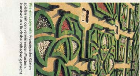
Wie ein Labyrinth Französischer Gärten spielen mit den verwirrenden Mustern, kunstvoll aus Buchsbaumhecken gemacht