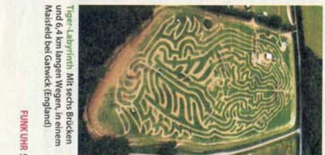
Tiger-Labyrinth Mit sechs Brücken und 6,4 km langen Wegen, in einem Maisfeld bei Gatwick (England)