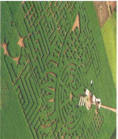
Irwege im Maisfeld 40.000 qm groß ist das Labyrinth von Jersbek bei Hamburg. Thema: das Sonnensystem mit seinen Planeten