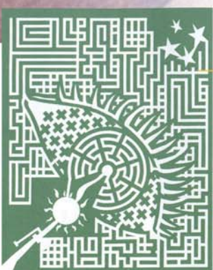
unten: Das Projekt 2002 – Das Sonnensystem – links: Luftaufnahme vom Mäslabyrinth 1999

Möchten Sie mit Schulklassen (Gruppenleiter und Lehrer haben freien Eintritt) oder zu einem (Kinder-)Geburtsstag das Labyrinth besuchen, erhalten Sie bei uns ermäßigten Eintritt und das Geburtsstagskind hat freien Eintritt. Eine Gruppenermäßigung beginnt ab 10 Personen.