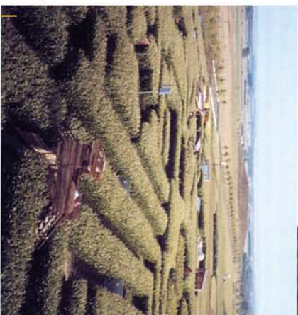
oben: In Zusammenarbeit mit der Landwirtschaftslehre Hannover entstand das Labyrinth unter dem Projekt „Agri21“ zur Expo 2000.