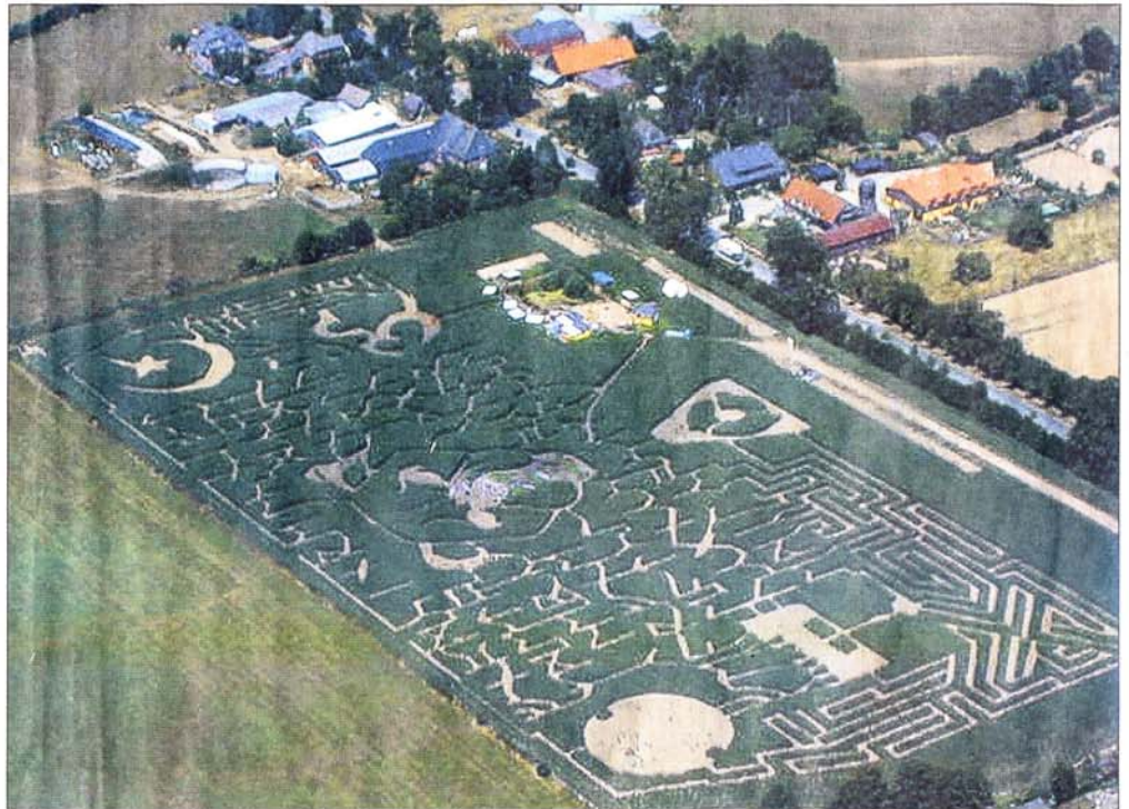
Über die Fläche von 5,5 Hektar verteilen sich 600 000 Pflanzen auf dem Maislabyrinth von Jersbek, das damit das größte in Deutschland ist.

Die Irrwege des Lebens sollen es laut Prospekt sein, der Weg zur Mitte und zu sich selbst, aber viele suchen einfach nur den Ausgang und ein kühles Getränk für ihre Mitte. Doch erstmal muss man den