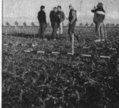
Foto links: Mit Hilfe von Freunden wurde bereits im April die rund fünf Hektar große Fläche mit Mais bepflanzt. Kaum waren die Pflänzchen wenige Zentimeter groß, wurden nach dem vorliegenden Plan die Wege des Labyrinths angelegt.

ist es sogar noch größer. Untergebracht ist das Labyrinth 2000, ein Projekt in Zusammenarbeit mit der Landwirtschaftskammer Hannover, im landwirtschaftlichen Bereich der EXPO. Unter dem Logo „Agri 21“ wird dort anschaulich und erlebbar demonstriert, was nachhaltiger Landbau bedeutet und wie sich die Landwirte mit den vor- und nachgelagerten Bereichen den vielseitigen Anforderungen der Gesellschaft am Beginn des 21. Jahrhunderts stellen. In einer eindrucksvollen Ausstellung werden die Besucher mit ihren eigenen Vorurteilen und der landwirtschaftlichen Realität konfrontiert. Derart eingestimmt lernen sie auf großzügig angelegten Demonstrationsflächen die verschiedenen Sorten, bedarfsgerechte Düngung und Pflanzenschutzvarianten unserer Kulturpflanzen kennen. Und bei sogenannten „Aktionstagen Landleben“ wird dort das Dorf sozusagen in die Stadt geholt - damit Jung und Alt einmal alles über das Leben im ländlichen Raum erfahren. „Sie werden hören, sehen, riechen, schmecken, fühlen. Und staunen“, verspricht der Katalog der Agri 21. Wo könnte sich das Mais-La-